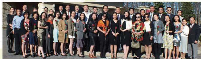
■ 满恩堂弟兄姐妹参加2016蒙特利尔渥太华恩爱夫妻营