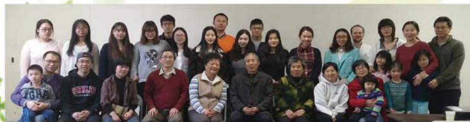
■ 满恩堂传福音小组与美国Plattsburgh弟兄姐妹与慕道友合影