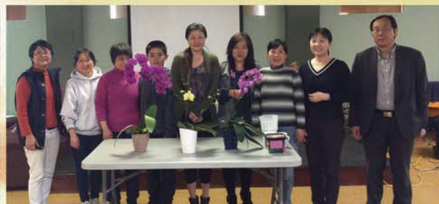
▲ 技能分享：兰花栽培 ▼ 路得姐妹快乐健美操