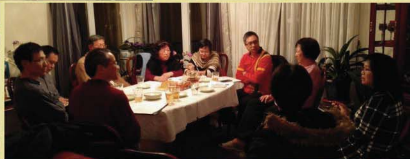
上左：粤语颂恩团契活动 上右：香柏团第一次同工会议