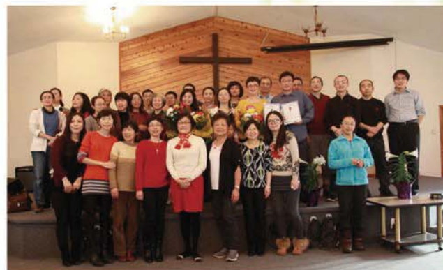
■ 满恩堂恩雨团2016复活节受浸纪念