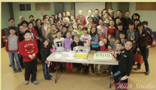
下左：恩雨团契庆生活动 下右：粤语颂恩团与国语恩雨团联谊活动