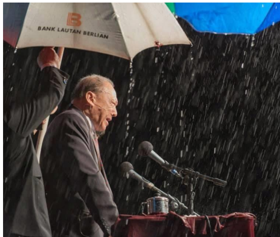
唐崇榮牧師2014年4月30日在印尼最東邊的城市—馬老奇（Merauke），雨中奮力佈道一景

「福音要論什麼呢？」福音不是論「什麼」，是論「誰」，然後這一個「誰」成全了「什麼」。整個福音的中心不是「什麼」，福音的中心是「誰」。保羅從整個事奉的認識論裡，他說我深知我所信的是