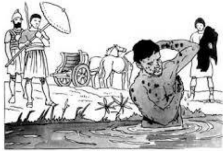
乃縵在約旦河裏沐浴

聖經是永生 神天地的上帝向他所造所愛的人说的话。天地將毀壞，神的话却長存永不廢去。這樣，每個被載入而出現在神的话中的名字就絕不尋常，必不是偶然被揀選。今