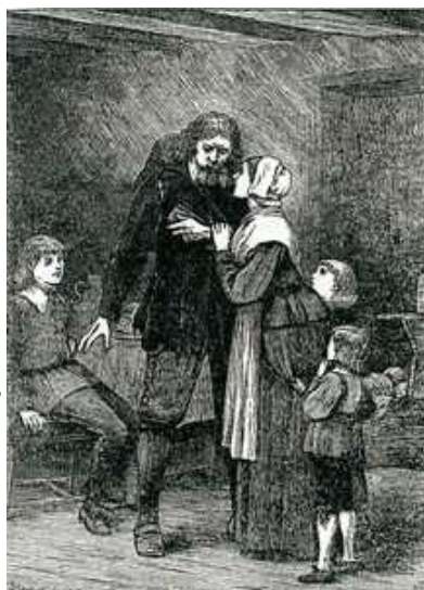
基督後把他的煩惱告訴了妻子和儿女

我在這世界的曠野中行走時，偶然見到一個洞穴，於是我就在那裡躺下睡著了。我在睡中作了一個夢，夢見一個衣衫襤褸，手上拿著一本書，背上背著一副重擔的人。他背朝著自己的家，正在全神貫注地讀手中的書。我看見他一面讀，一面傷心地流淚。最後，他竟情不自禁地號咷大哭起來，嘴裡還在不停的喊著：「我應該怎樣做呢？」（徒二37）。